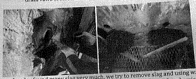
After open header found many slag very much, we try to remove slag and using water for cleaning. At left side and right have slag very much because last time after chemical clean client no open header for remove slag and inspection inside header after chemical clean, but at front header have a little slag because after chemical clean client open header for cleaning and inspection inside header.