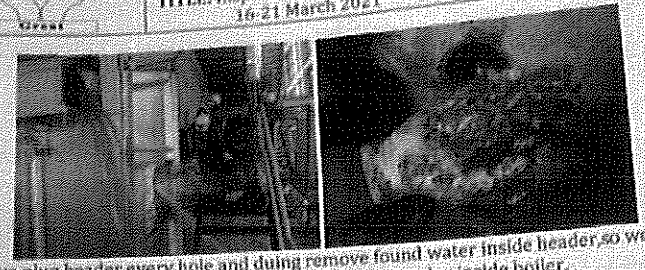
Remove plug header every hole and during remove found water inside header, so we found drain valve of side header plug because slag inside boiler.